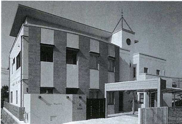
広島島の気候風土に根ざした「広島型」の住まい

同研究会では、住まいから住環境・街づくりまでのさまざまな視点から住居環境を考え、提案していますが、その活動の内容は「住環境に関する調査・研究」「居住に関する